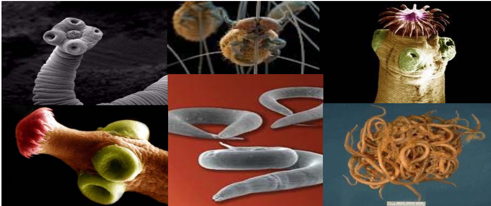
Abb. 3: Beispielhaft verschiedene Formen von Parasiten, Haken- u. Bandwürmer, Rund- u. Plattwürmer

Von Parasitismus spricht man, wenn der Nahrungserwerb z.B. eines Parasiten über einen sogenannten Wirt oder Wirts-Organismus erfolgt. Nicht selten wird der Wirt, der den Parasiten erst das Leben ermöglicht, geschädigt oder auch umgebracht.