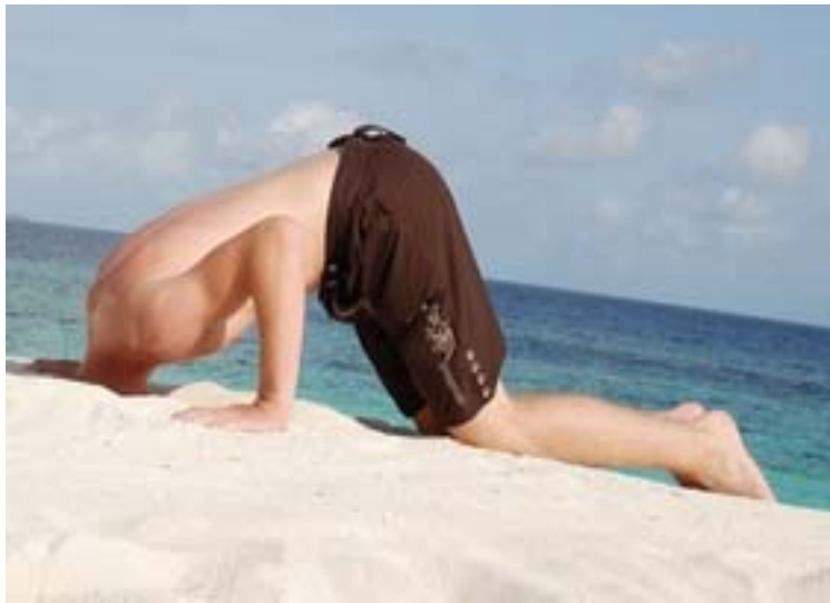
Abb. 1: Vergessen Sie die Indoktrination durch die Medizin, es gibt für jede Krankheit eine Lösung, nichts ist unmöglich.

Mit den Informationen in diesem Buch halten Sie den Schlüssel für eine dauerhafte Gesundheit in Ihren Händen! Sie werden – ohne Wenn und Aber – verstehen, warum Sie erkrankt sind und wie Sie wieder vollständig gesund und gesund bleiben.