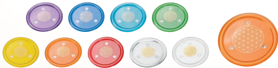
Energie-Untersetzer Ø 14 cm