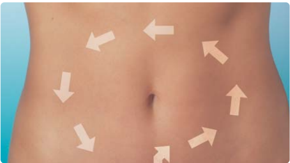
Massagerichtung bei der Bodengymnastik

6. Bodengymnastik: Damit der Tee möglichst weit in den Dickdarm läuft, sollte nach dem Herausziehen des Endstückes, auf dem Rücken liegend, eine Kerze gemacht werden. Zurück auf dem Boden, wird der Unterleib vom Schambereich zum Bauchnabel hin und anschließend gegen den Uhrzeigersinn massiert (siehe Zeichnung). Dann wird eine Rolle linksherum ausgeführt. Danach wird wieder massiert, nun wieder eine Kerze, eine Rolle rechtsherum, Kerze usw. In diesem Rhythmus geht es 7–10 Minuten weiter.